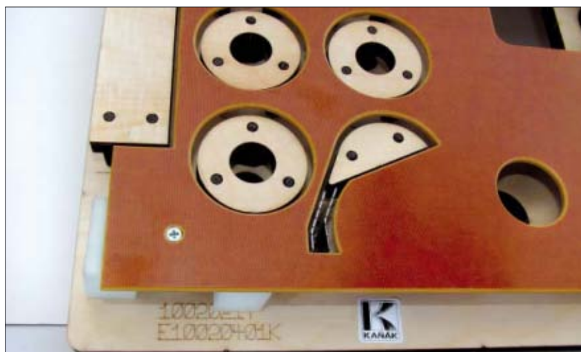
Horní výlup s přítlačnou deskou

Výsekové nástroje pro plnou a vlnitou lepenku, pro etikety, těsnění, gumu a jiné materiály, vylupovací a separační nástroje, štočky pro reliéfní, horkou a horkou reliéfní ražbu, Braillovo písmo, spodní ocelové nebo pertinaxové rylovací přípravy, negativní násek, návrhy a vývoj obalů a školení v oblasti zvyšování produktivity výroby s nástroji firmy Kaňák.